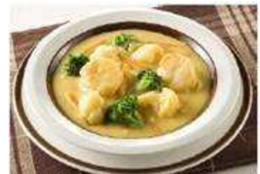
花野菜と帆立の クリームカレーシチュー

ところが、実際にはホワイトソースはどんなクリーム系の料理にも使える汎用ソースで、その中でも王道がクリームシチューなのです。当社のホワイトソースのパッケージデザインにもクリームシチューの写真を使っています。本キャンペーンを通じて、あらためてホワイトソースでつくるクリームシチューの美味しさを伝えていくことが、市販用ホワイトソースのトップメーカーとしての責任と考えています。